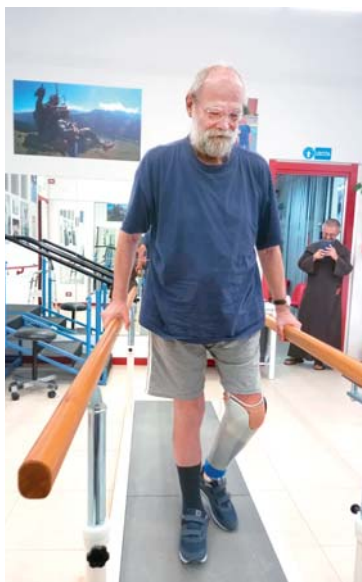
Nácvik chůze s protézou.

kací. Pár drobných modliteb rozhodně neuškodí. Možná už nebudu moci chodit jako dřív, ale budu prosit Pána o sílu.