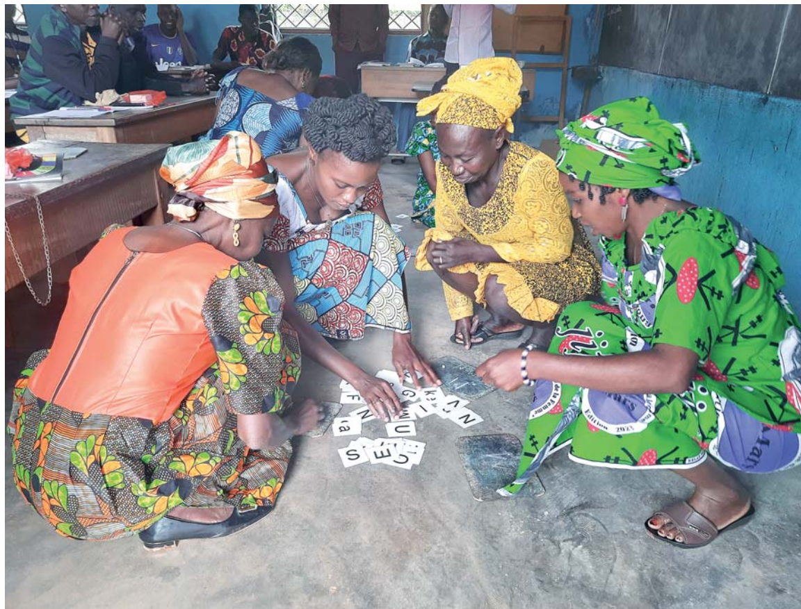
Ve Škole hrou se pedagogové učí využívat třeba karty s písmenky nebo didaktické kresby.