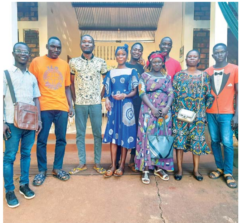
Díky podpoře českých dárců mohou studovat na vysoké škole i tito mladí lidé.

Během obou pobytů jsme využili příležitost být s dětmi. Poprosili jsme je, aby nám vytvořily obrázky na nová trička do našeho benefičního obchodu. Děti z toho byly nadšené a s velkou radostí nakreslily stovku obrázků. Už nyní se můžete těšit na nové modely na Vánoce!