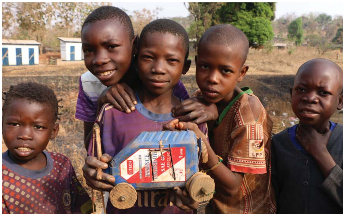
Díky vašim darům můžeme pomáhat těm, kteří v nejistotě prožijí celý život.

Jaká je ale naše budoucnost? Na jaře letošního roku jsme museli velmi rychle přijmout taková opatření, aby současnou krizí Siriri přestála a přitom dokázala dál pomáhat potřebným. Z důvodů finančních, ale také bezpečnostních jsme se rozhodli pozastavit vzdělávací program „Škola hrou“, který byl posledních pět let naší vlajkovou lodí. Hledáme možnosti,