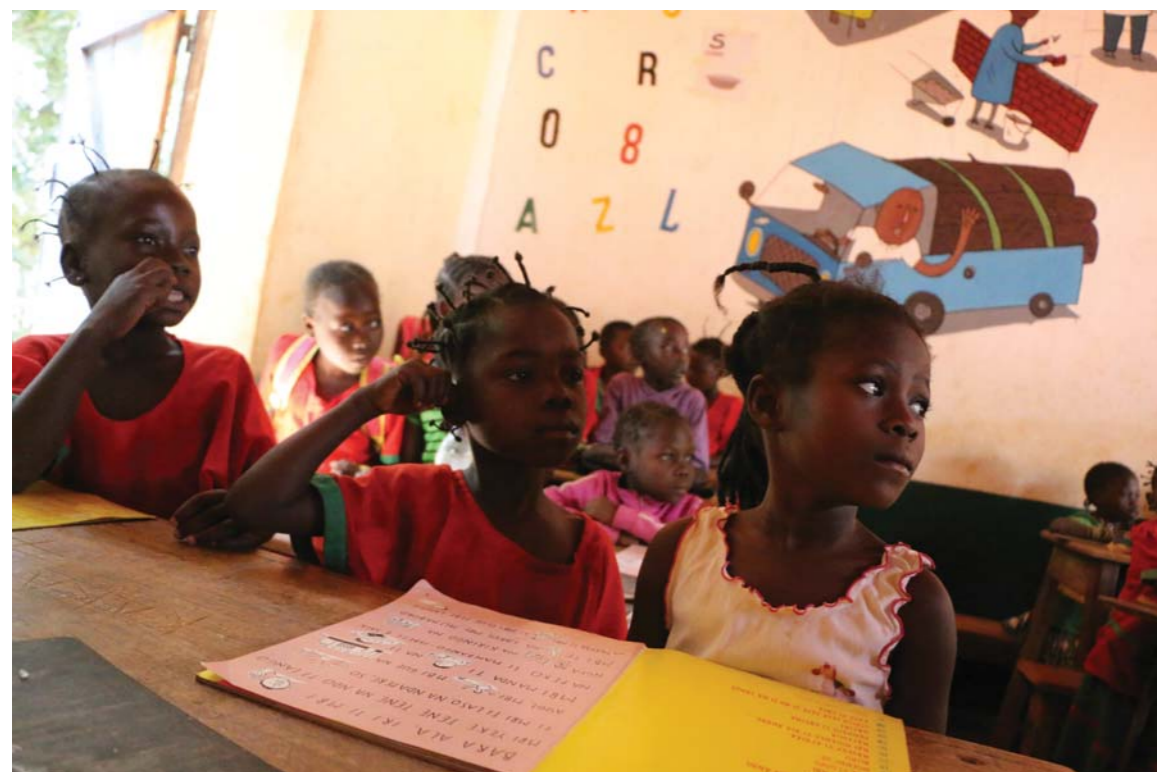
Jeden slabikář slouží i pěti dětem zároveň.

JF: S architektem Osamuem Okamurou právě dokončujeme knížku o urbanismu, na které jsme dělali několik měsíců. Obrazový doprovod tvoří fotografie různých našich modelů měst. Vydá ji nakladatelství Labyrint. (sch)