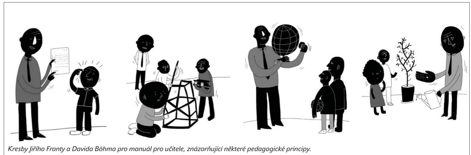
Kresby Jiřího Franty a Davida Böhma pro manuál pro učitele, znázorňující některé pedagogické principy.