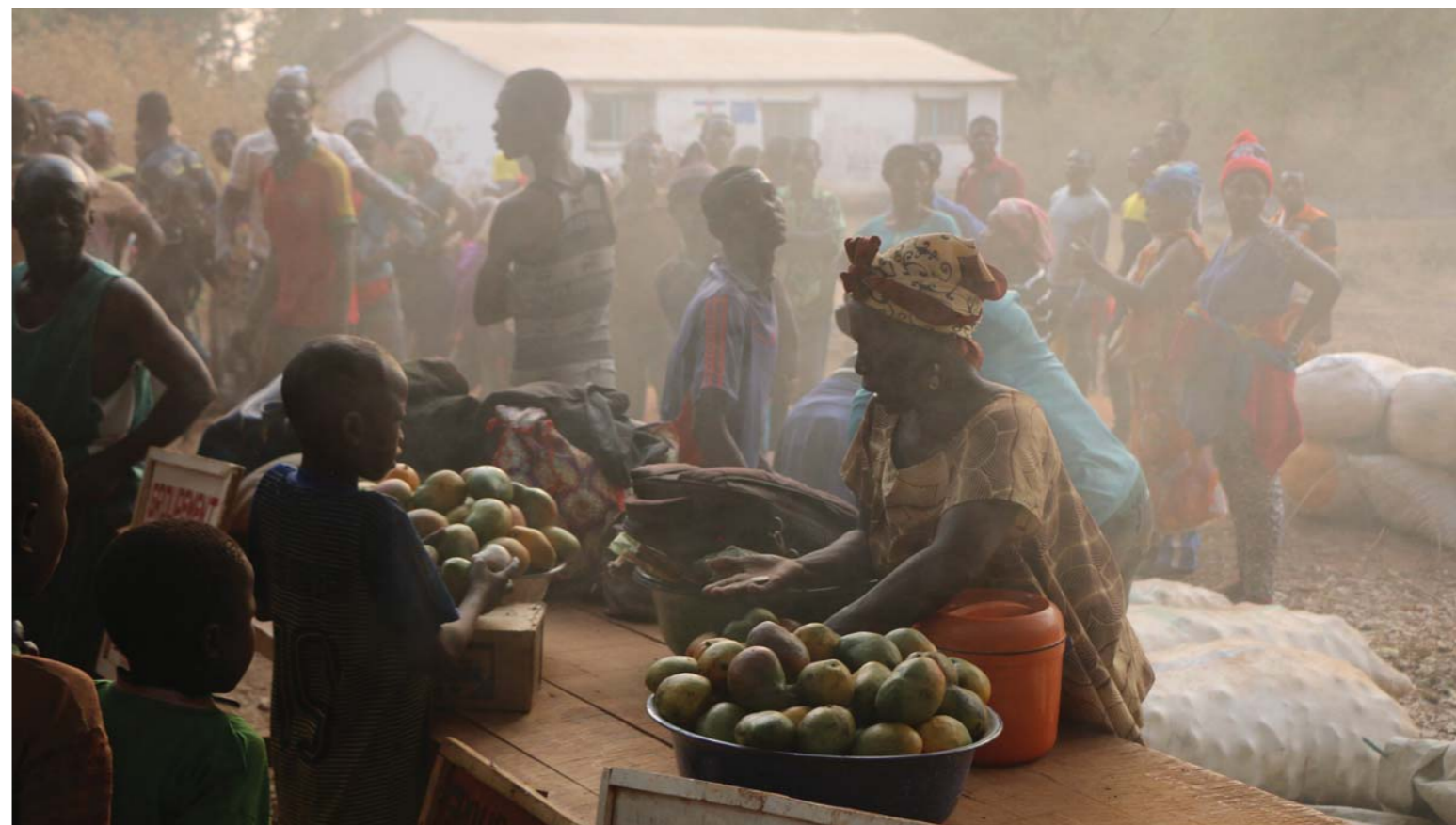
V knize Komenský by zajásal se dočtete o práci Siriri i o každodenním životě a zápasích Středoafričanů.

ská témata úplně přirozeně propojená i s životem farnosti. Misionáři v SAR se prakticky neustále pohybují mezi místními lidmi a díky tomu umí objevovat univerzálně schopné lidi, ať jsou to ženy, nebo muži. Nabídnou jim možnost rozšířit si vzdělání v diecézních vzdělávacích centrech, kam přijedou s celou svou rodinou. Někteří dospělí si tam doplní základní gramotnost, jiní si osvojí řemeslo nebo absolvují učitelství, zdravotnický či jiný kurz a ještě další zájemci si zvolí studium katechetických dovedností. Pak se vracejí do své vesnice a stávají se „tahouny“. Časem taková rodina přebírá odpovědnost a pro misionáře se stává prodlouženou rukou i zdrojem cenných informací, třeba co se týká bezpečnostních nebo epidemiologických témat, za něž jsou vděčné i mezinárodní zdravotnické organizace.