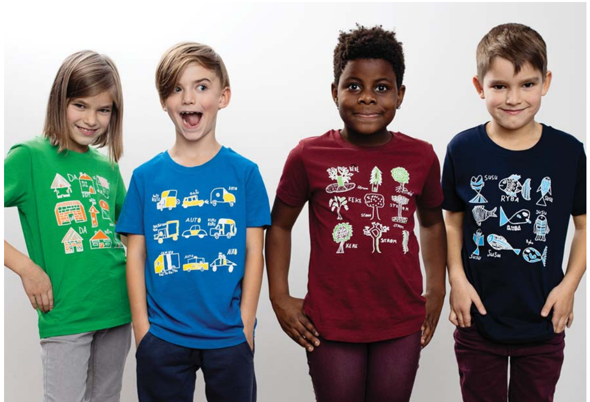
Originální motiv udělá radost a podpoří činnost Siriri.

S obrázky jsem ale měla ještě jeden záměr. Siriri od počátku financuje část své činnosti z prodeje triček s originálním potiskem v benefičním obchodě Ruku v ruce, jehož hlavní myšlenkou je vzájemnost: dopřej sobě a pomoz druhým. Siriri garantuje, že z každého