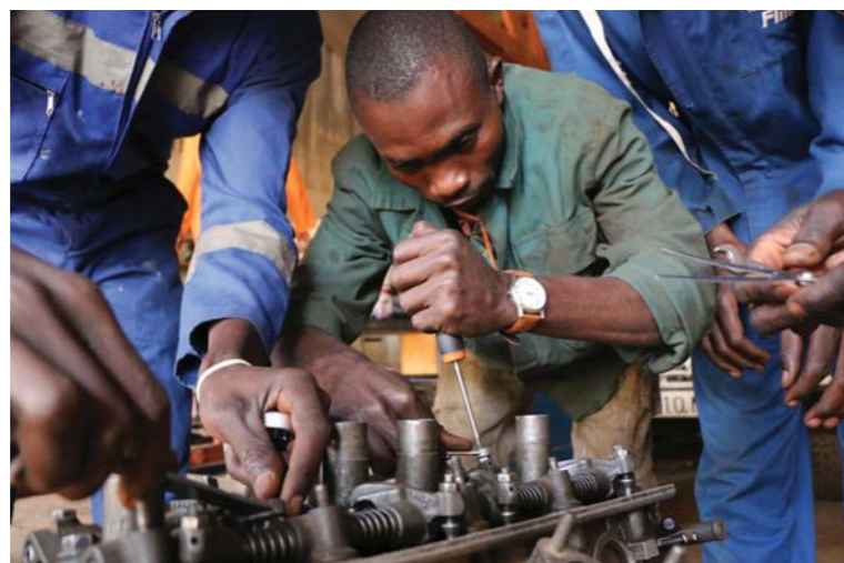
Namísto bojů opravovat auta.

V letošním roce byly ve spolupráci s místní neziskovou organizací vypsány mimořádné rekvalifikační kurzy pro bývalé rebely. Dva kurzy absolvovalo celkem 105 bývalých členů ze tří rebelských skupin. Siriri podpořila v letošním roce tuto školu částkou 78 000 Kč.