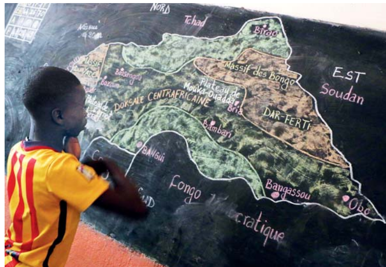
Do středoafričských škol vnášíme podněty J. A. Komenského.

SIRIRI podporuje projekty v oblasti zdravotnictví, zemědělství a zejména vzdělávání. Popis dalších projektů najdete na webových stránkách organizace www.siriri.org