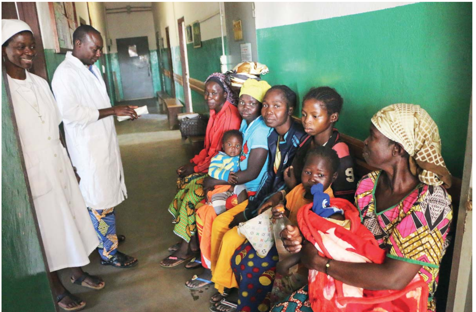
V čekárně okresní nemocnice ve městě Bouar.

Pro mě je cena znamením povzbuzení a naděje, že navzdory bídné, nelidské situaci, která v naší zemi vládne, existují i pozitiva. Je důkazem toho, že vždy může vzniknout něco krásného a že by se mladí lidé neměli vzdávat, ale doufat a rozhodlaně pracovat. Pro