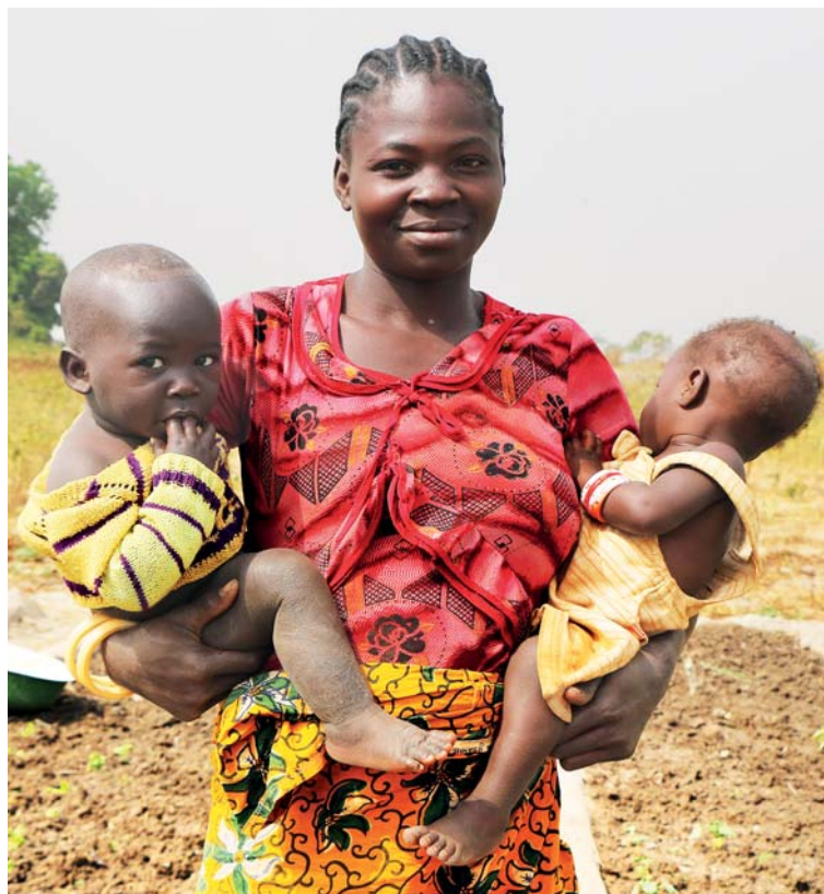
Díky vaší pomoci můžeme pomáhat těm nejpotřebnějším.