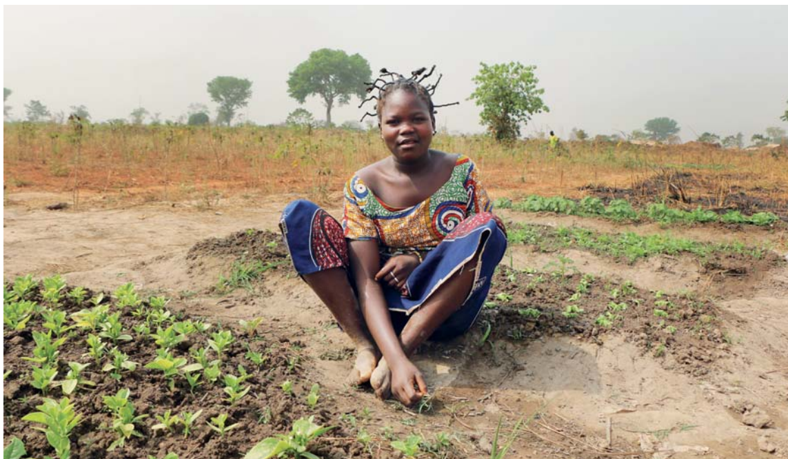
Africké země mají tradičně větší podíl mladších obyvatel, proto zde – zdá se – nemá koronavirus tolik obětí na životech.