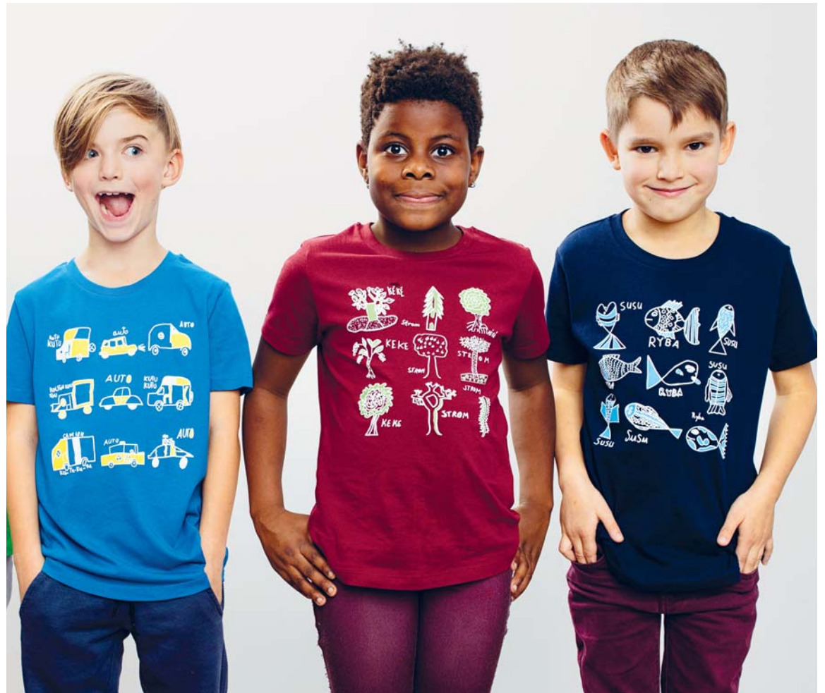
Originální dárek udělá radost a podpoří činnost SIRIRI.

Sortiment obchodu pravidelně obměňujeme – tak se i vy můžete odměňovat častěji, a častěji tím podpořit ty, kterým se pomoci nedostává a kterým můžeme přispět z našeho přebytku. Kromě triček a tašek benefiční obchod Ruku v ruce nabízí i taštičky ušité z afrických látek, ekologické pytlíky na nákupy, africké šperky, hračky, háčkané panenky a ozdobné věnce