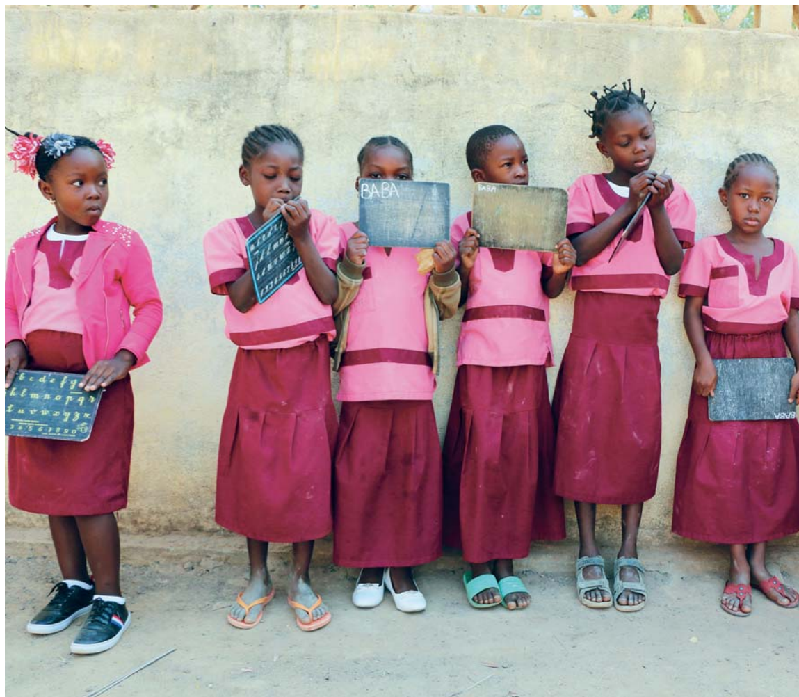
Důvěra dárců, dobré nápady a vytrvalost mohou přinést skutečný posun vpřed.

Budování neziskové organizace, která má za cíl pomáhat dlouhodobě, efektivně a smysluplně, musí splnit několik důležitých podmínek: vytvořit akceschopný a inspirativní tým, získat širokou důvěru a podporu laskavých dárců a mít spolehlivý vztah s partnery v SAR. Snad mohu říct, že to vše se nám během 15 let podařilo.