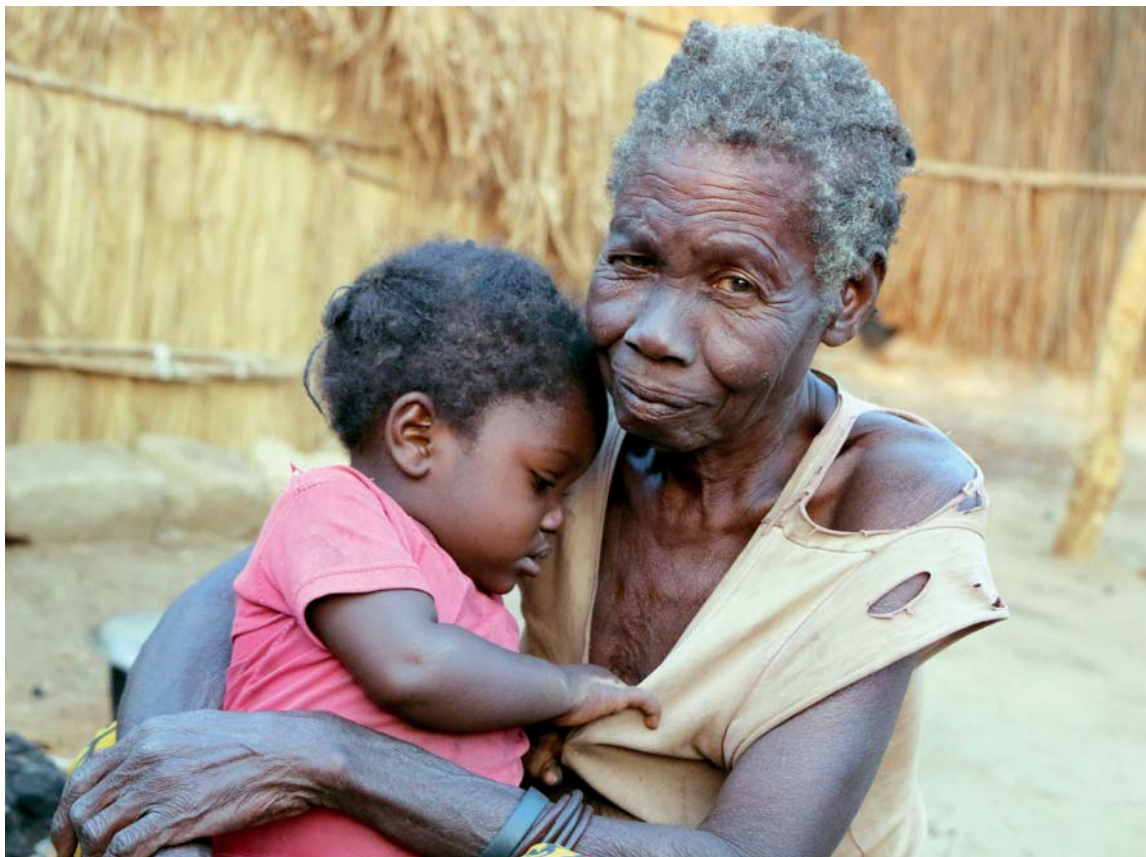
Z krizí vyjdeme jen společně, říká papež František. Děkujeme, že se na tom podílíte.

Takovou zemí je i SAR. Úkolem naší doby je porozumění světu jako celku a vnímání toho, jak jsou lidé, místa