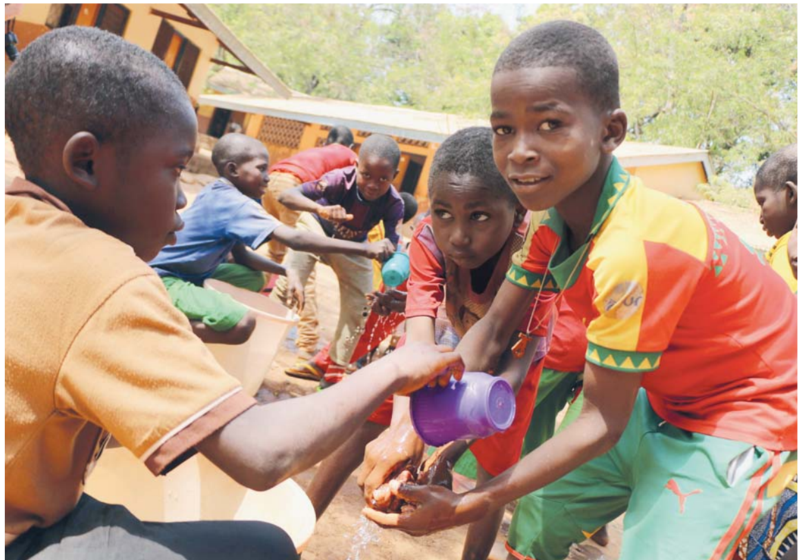
SAR je mladá země s velkým podílem dětí. Podporovat je má proto velký smysl.

Když od základní školy vyjdete pěšinkou mezi stromy na druhý vrchol kopce, minete nejdříve mateřskou školu a pak přijdete k domu, kde žijí misionářky italského řádu Dcery Panny Marie Milosrdné. Ty se s karmelitány dělí o organizaci a chod všech projektů.