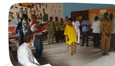
Škola hrou v SAR