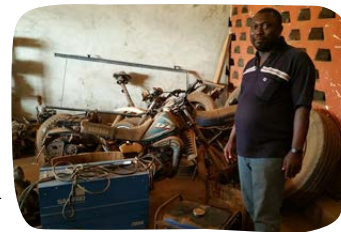
Učiliště pro automechaniky