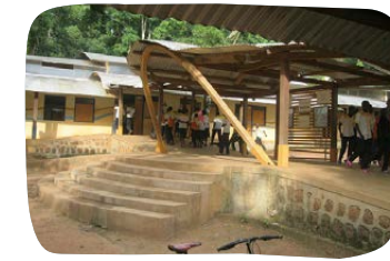
Střední škola v Bozoum

Grant MZV ČR: 4 940 000 Kč Hlavní sponzoři programu Škola hrou v SAR: 150 000 Kč Individuální dárci: 3 005 000 Kč Ambasáda ČR v Nigérii: 520 000 Kč Celkové investice do projektů SIRIRI v SAR: 8 615 000 Kč