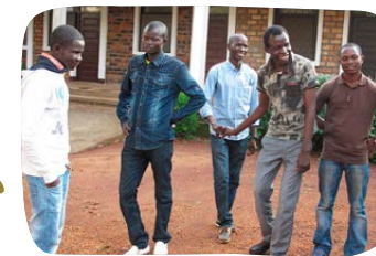
Podpora 16 VŠ studentů

Náklady 209 000 € (90 % MZV, 10 % SIRIRI)