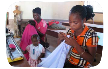
Centrum vzdělávání žen „Kana“