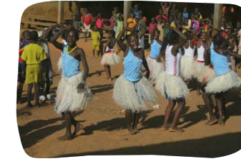
Stacionář pro sirotky