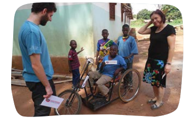
Santé – rozšíření kapacity koordináčního Centra Svatého Michala v Bouar pro léčení a asistenci osobám postiženým HIV/AIDS

Náklady 209 000 € (90 % MZV, 10 % SIRIRI)