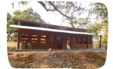
Dostavba dvou tříd střední školy v Bozoum