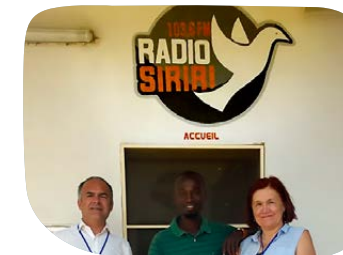
Radio SIRIRI v Bouaru