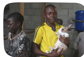
Podpora školáků v Bouar