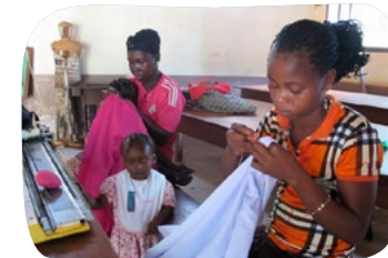
Centrum vzdělávání žen „Kana“ Investice 52 000 Kč