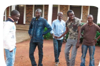
Podpora 16 VŠ studentů Investice 416 000 Kč