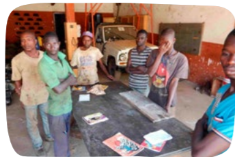
Učiliště pro automechaniky Investice 156 000 Kč