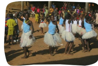
Stacionář pro sirotky Investice 260 000 Kč