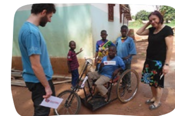
Santé – posílení kapacity koordináčního centra Svatého Michala v Bouar pro léčení a asistenci osobám postiženým HIV/AIDS Investice 209 000 EUR (90 % MZV, 10 % SIRIRI)