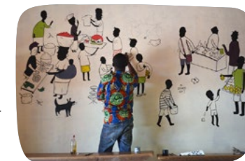
Realizace 25 didaktických nástěnných kreseb ve školách Investice 374 400 Kč Projekt podpořen ambasádou ČR v Abuiji