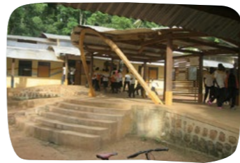
Střední škola v Bozoum Investice 260 000 Kč

Grant MZV ČR: 4 940 000 Kč Hlavní sponzoři programu Škola hrou v SAR: 689 000 Kč Individuální dárci: 2 496 000 Kč Ambasáda ČR v Nigérii: 374 000 Kč Celkové investice do projektů SIRIRI v SAR: 8 499 400 Kč