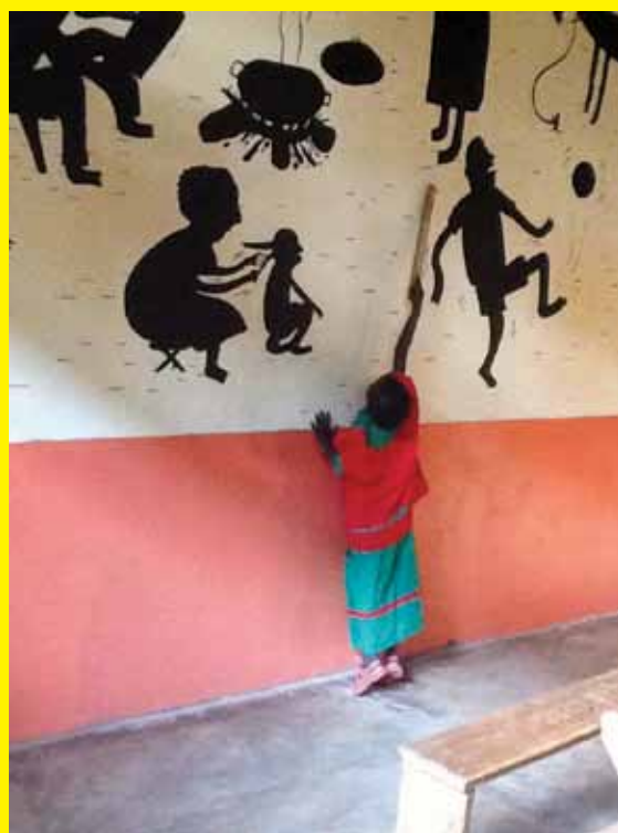
Utilisation de la fresque didactique en classe