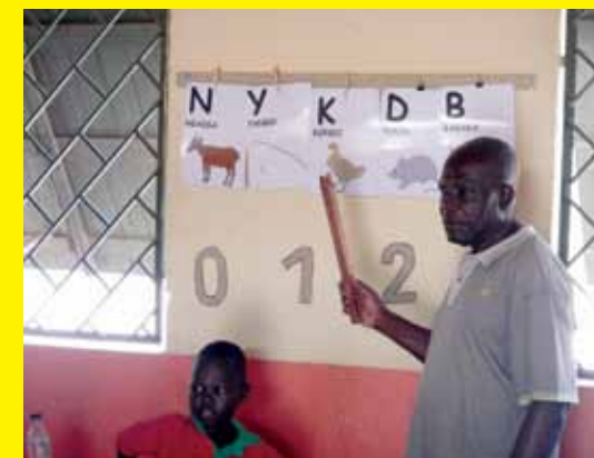
Enfants en classe. Au mur sont affichées les cartes illustrées de l'Alphabet vivant.