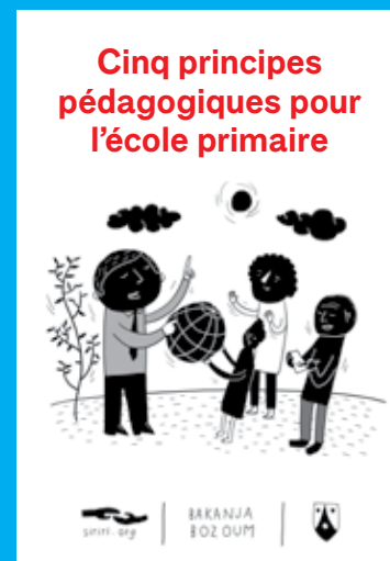
Couvertures du syllabaire et du guide pédagogique «Cinq principes pédagogiques pour l'école primaire»