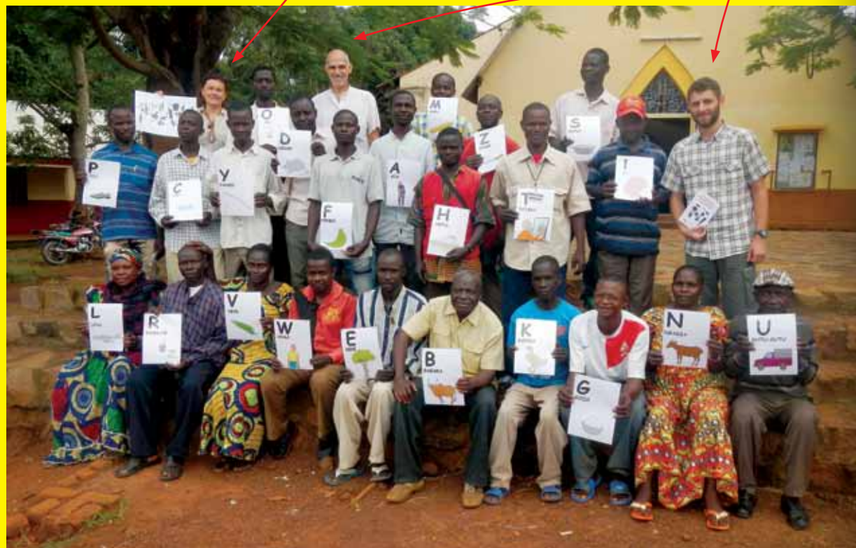
Photographie prise lors de la formation pilote pour instituteurs