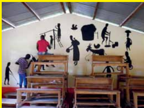
Réalisation d'une fresque didactique sur les murs d'une classe

Dans deux classes, nous avons peint au mur une fresque didactique. Cette fresque pallie au manque de manuels scolaires et d'images pédagogiques.