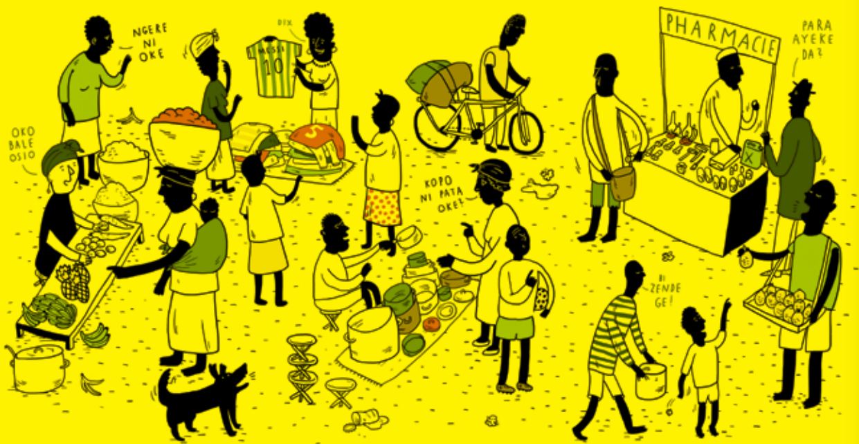
Esquisse d'une fresque sur le thème du marché

Au cours de leurs séjours en RCA, les représentants de SIRIRI ont rencontré de nombreuses personnes ayant une excellente connaissance du terrain en République Centrafricaine.